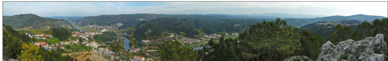
Panorâmica sobre o vale do Mondego e Penacova, do Penedo de Castro