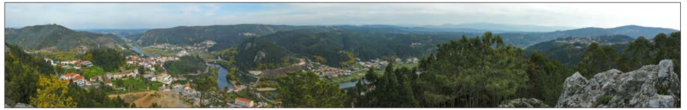
Panorâmica sobre o vale do Mondego e Penacova, do Penedo de Castro